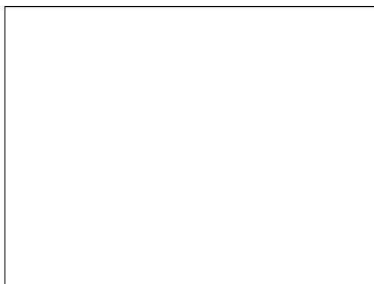
図 1 □ レンブラント《ダナエ》(1636) (例) (太字、 □ は全角スペース)

□□□□□□□□□□□□□□□□□□□□ □□□□□□□□□□□□□□□□□□□□ □□□□□□□□□□□□□□□□□□□□ □□□□□□□□□□□□□□□□□□□□